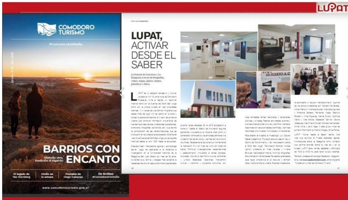
Nota dedicada a LUPAT en la Revista Nº 2 de Comodoro Turismo. 2021.

La gestión cultural desplegada desde LUPAT parte de la conceptualización que realiza el artículo 15 del Pacto Internacional de Derechos Económicos, Sociales y Culturales y sus Protocolos ratificados por Argentina “tomar parte libremente en la vida cultural de la comunidad, a gozar de las artes y a participar en el progreso científico y en los beneficios que de él resulten”. Ello implica que se requieren, por un lado, políticas públicas que faciliten su efectivización y por otro, actores como los gestores culturales que las hagan realidad. Es decir, de técnicos formados para producir, desarrollar, implementar y difundir acciones, proyectos y programas culturales, considerando la gestión de los recursos disponibles y la planificación sin descuidar la generación de canales de participación comunitaria en la dinámica cultural territorial. Se trata de pensar en el poder de la cultura como transformadora de la sociedad y no solo como recreativo de la vida social. De ahí que los gestores culturales pueden y deben operar en diversos ámbitos de la cultura, tanto en la Administración pública, en Instituciones Privadas como en Organizaciones No Gubernamentales, como LUPAT.